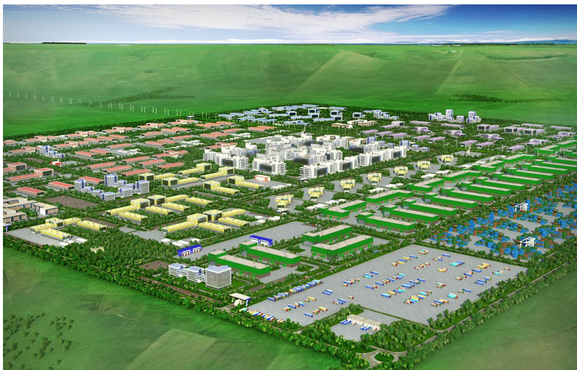
Рис.3. Территория Фармапарка

Границы участка – с севера, запада, юга и востока – общая долевая собственность без выделения паев на землях с/х назначения в границах бывшего колхоза «Путь Ленина».