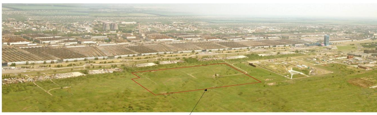
Рис.1. Границы землеотвода Технопарка

Проект Технопарка по своим социально-экономическим характеристикам относится к крупным и среднесрочным и отвечает целям основных инвесторов, а именно: