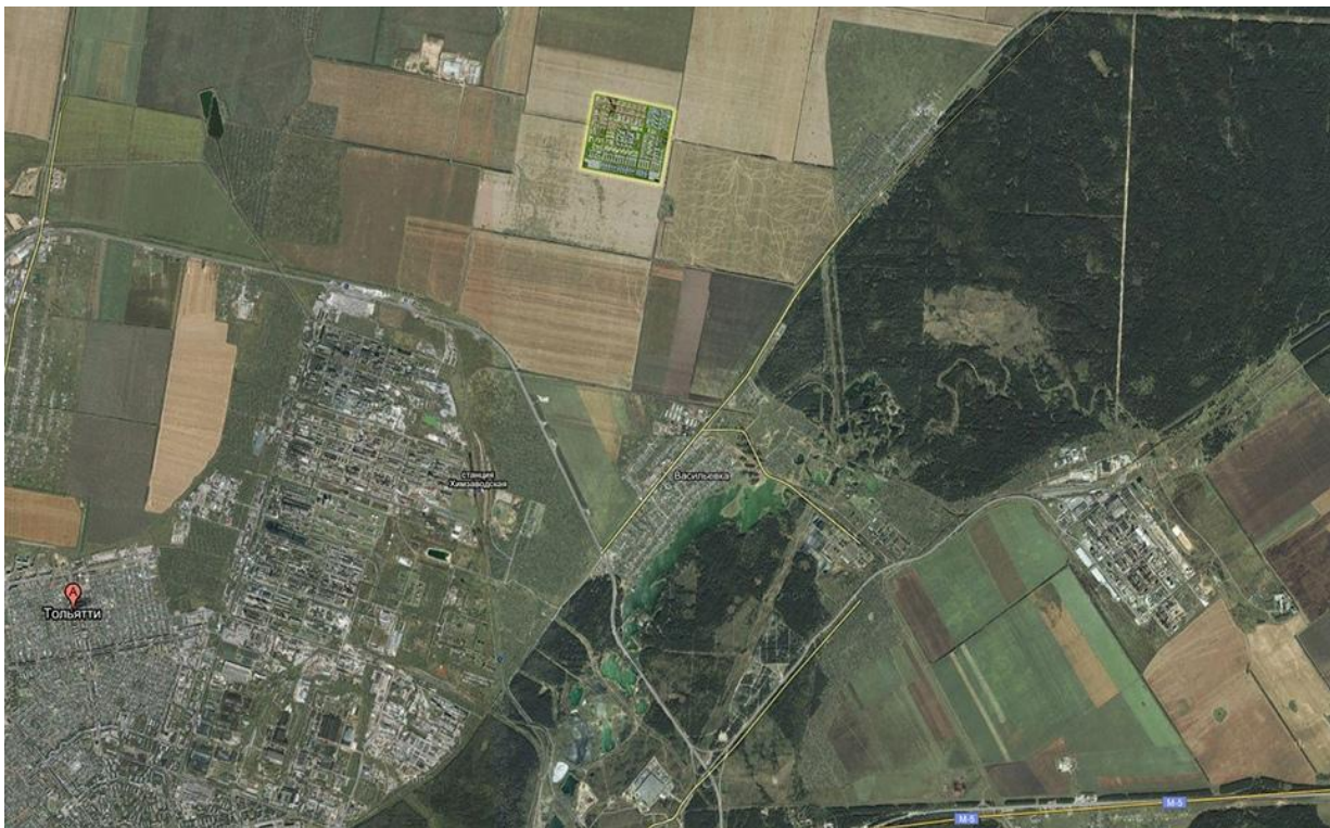
Рис.2 Планируемая территория Фармапарка

Границы участка – с севера, запада, юга и востока – общая долевая собственность без выделения паев на землях с/х назначения в границах бывшего колхоза «Путь Ленина».