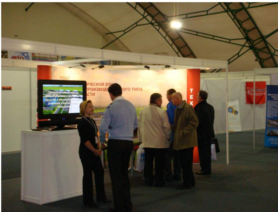
Презентация инвестиционных проектов на третьей Международной специализированной выставке-форуме «Автопром. Автокомпоненты-2009».

Параллельно с выполнением работ по реализации проекта ОЭЗ на территории Самарской области, ОАО «ТПТП» проводит активную работу по проекту создания технопарка на территории г.о. Тольятти. Проект технопарка рассматривается в системной взаимосвязи с проектом ОЭЗ и призван обеспечить размещение тех промышленных производств, которые в силу требований Федерального законодательства не могут быть размещены на территории ОЭЗ.