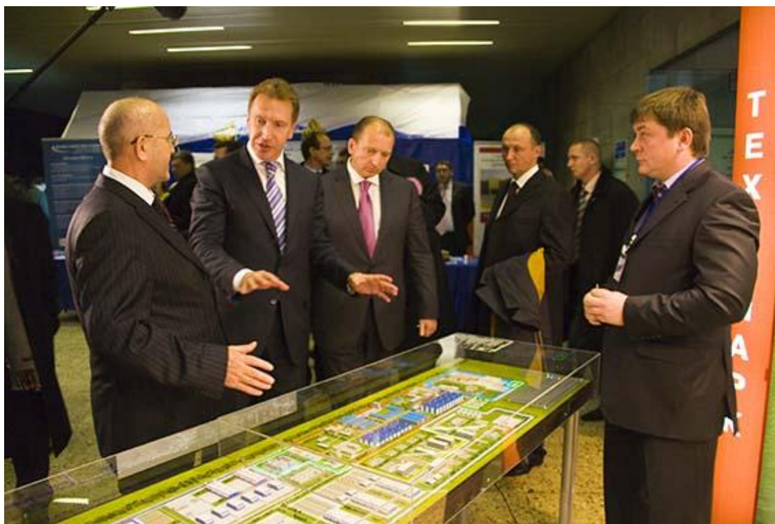
Презентация проекта ОЭЗ ППТ Первому заместителю Председателя Правительства РФ И.И.Шувалову. 9 ноября 2009 года.

В ноябре 2009 года, в рамках рабочего визита на ОАО «АВТОВАЗ», первый заместитель Председателя Правительства РФ Игорь Шувалов провел совещание, в ходе которого оценил проект создания ОЭЗ в Самарской области как один из наиболее подготовленных и перспективных проектов.